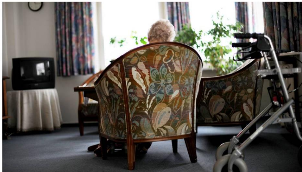
Fattige kommuner har ofte vært mer innovative og gitt bedre omsorg, ifølge konsulent i Agenda Kaupang

Fattige kommuner har ofte bedre tilbud enn de store og rike, ifølge konsultentselskapet Agenda Kaupang. De advarer mot å tro at mer penger løser alle problemene i eldreomsorgen.